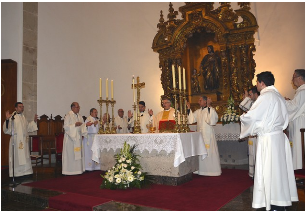
Eucaristía en memoria de Santo Tomás de Aquino en el Seminario