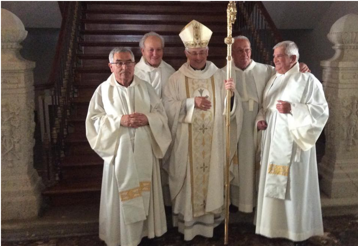
Membros do clero lucense que celebran as vodas de ouro sacerdotais, acompañados do señor Bispo