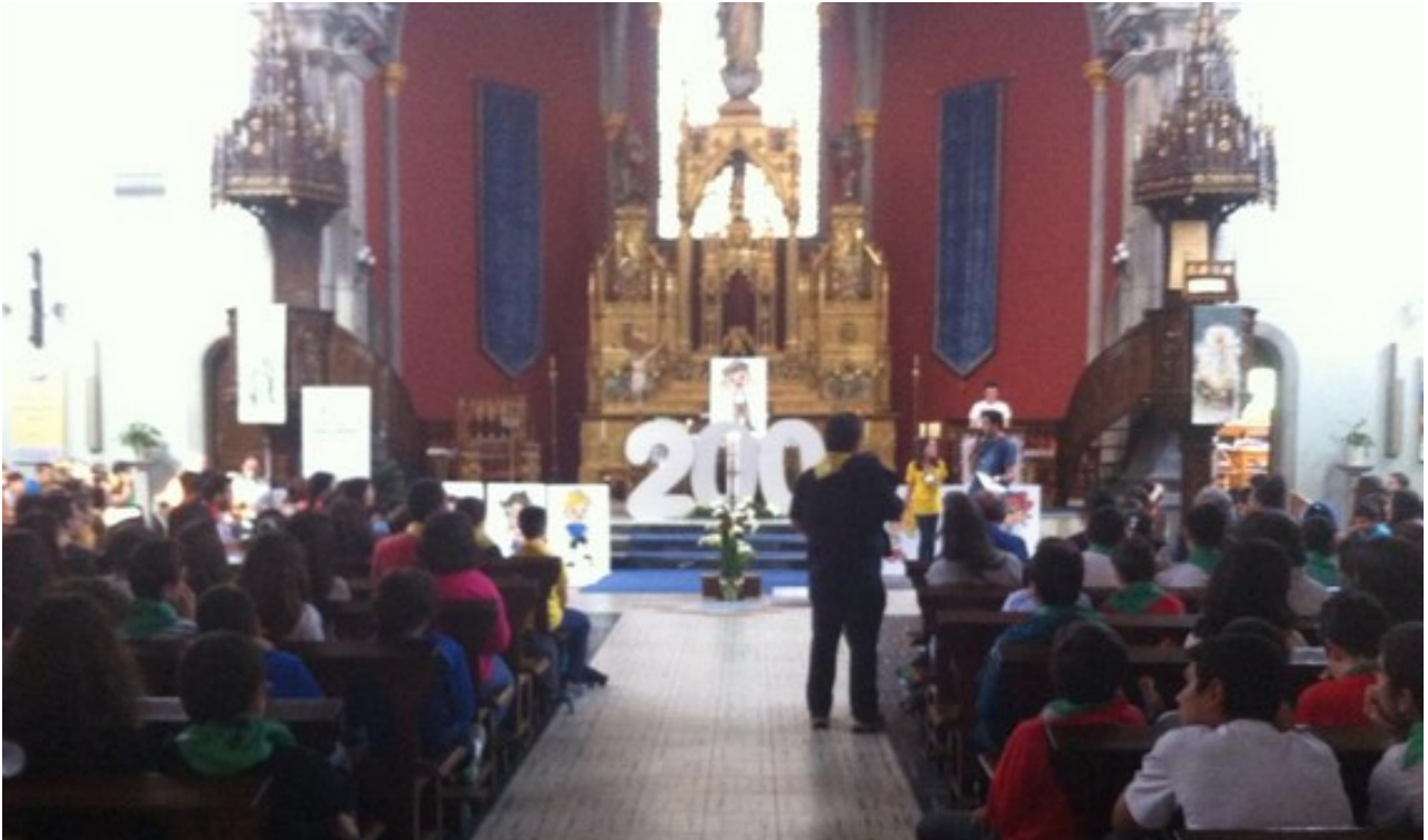
Celebración final da xuntanza do IEF en Galicia, cos nenos de Abertal, Amencer, Abeiro e Ateibo na igrexa da Milagrosa, Lugo