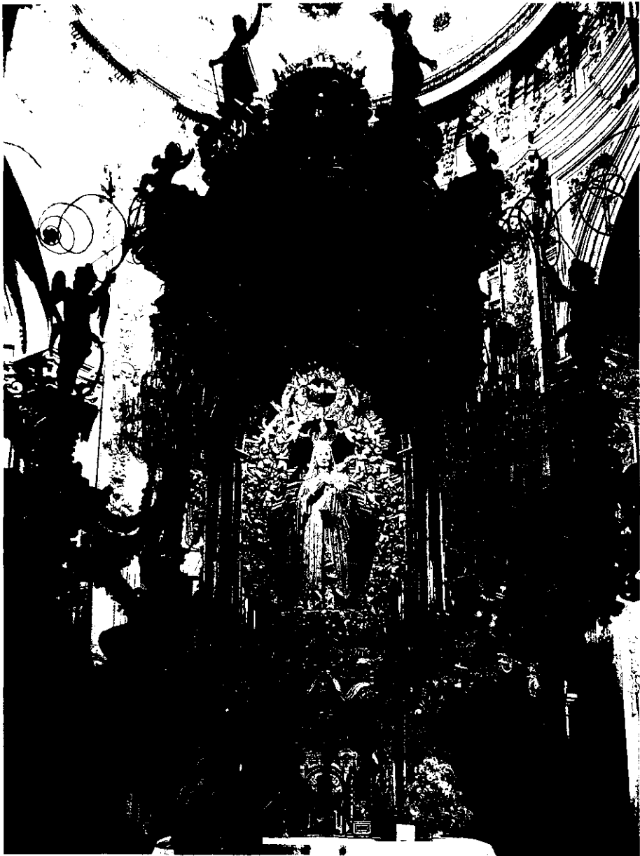
Capela da N.ª S.ª dos Olhos Grandes