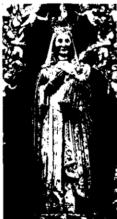
Imaxe da Virxe

crenza de que, por exemplo, quen morría o 15 de agosto ía directamente ó Paraíso, aproveitando que as portas estaban momentáneamente abertas para recibir á Nai de Deus. Por outra banda, cada fiel tiña a súa